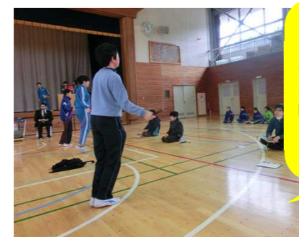
6年生にとっては、最後のなわとびフェスティバルでした。本番だけでなく、練習の時からリーダーとしてしっかりがんばってくれました。

もっと感心したのは、高学年が低学年に、中学年が低学年に分かりやすく、優しく跳び方を教えていることでした。初めは、おそろおそろ跳んでいた1年生が、なわとびフェスティバル本番では、ばんばん縄を跳び越していく成長ぶりに感心させられました。また、優しくかかわってくれる2~6年生の子どもたちを今までよりも、もっともっと好きになったなわとびフェスティバルでした。