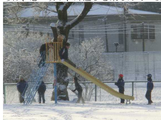
ある雪の日、楽しく遊んでいる子どもたちに混じって・・・だれでしょう？

3学期から待ちに待った校庭が使えるようになり、サッカー、おにごっこ、遊具あそび・・・子どもたちは、思い切り、外遊びを楽しんでいます。