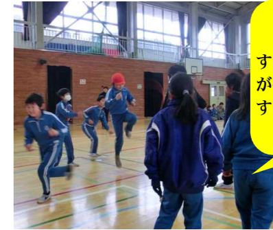
どのグループも練習するごとに確実に回数が増えました。すごい!