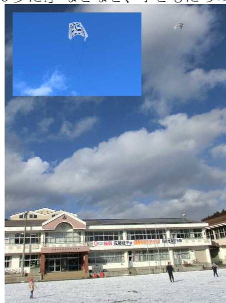
1年生のたこあげの様子です。真っ青な空にどこまでも飛んでいくたこに子どもたちは夢中でした。