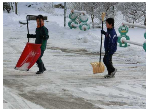
横小ボランティアのみなさんです。

どこまでも上がっていくたこに子どもたちの成長を重ね合わせ、「がんばれ!横小の子どもたち」と願わずにはいられないひとときでした。